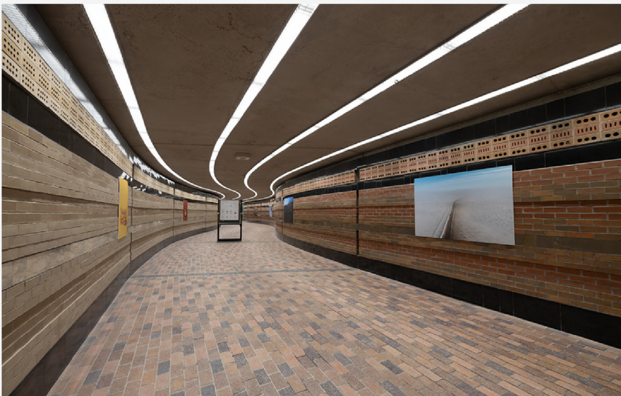
oeuvre Pat Kane, Festival Art Souterrain 2024