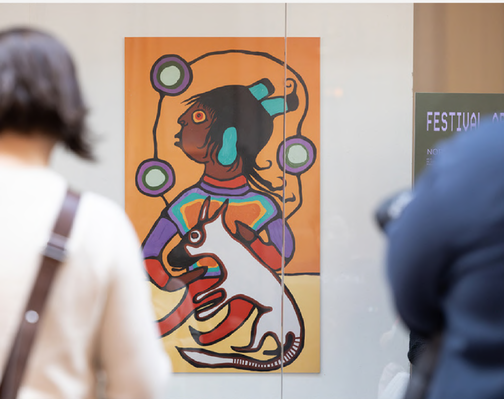
oeuvre Norval Morriseau, 2024