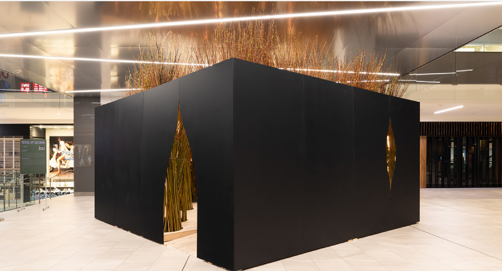
oeuvre Le Comité, 2024