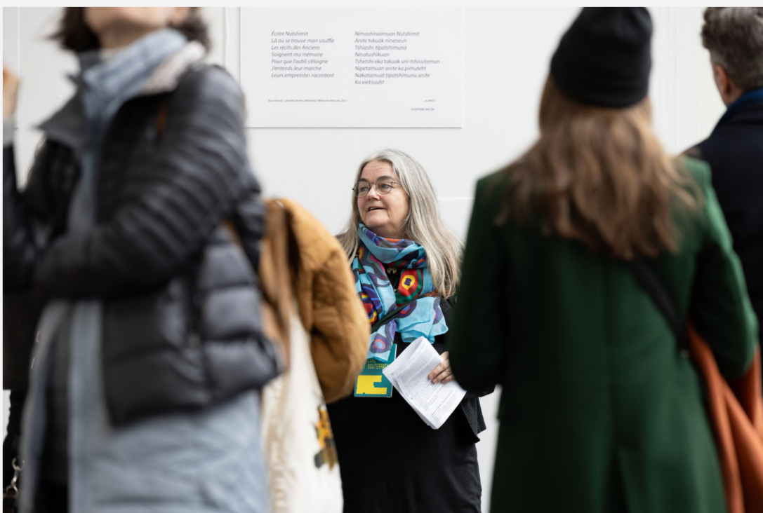
oeuvre Joséphine Bacon, Festival Art Souterrain 2024