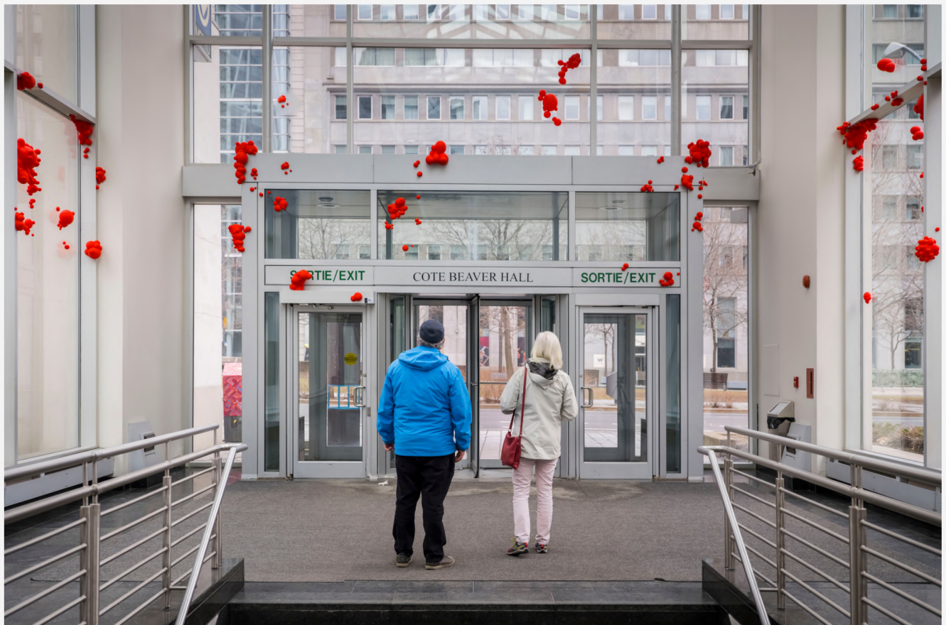
festival Art souterrain 2022

Les installations éphémères et de type in situ sont à privilégier, de même que les performances, les projets photographiques, audios et vidéos.